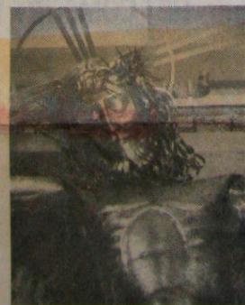
Detail van koperen kruisbeeld, r.k. kerk te Oisterwijk.